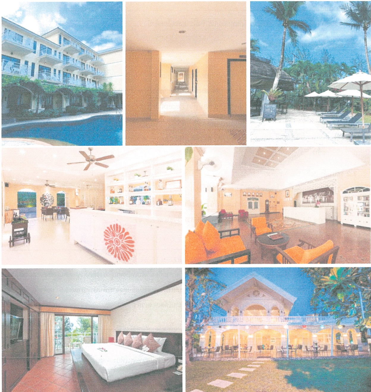
รูปภาพที่ 1.3 การใช้พื้นที่ของโครงการ