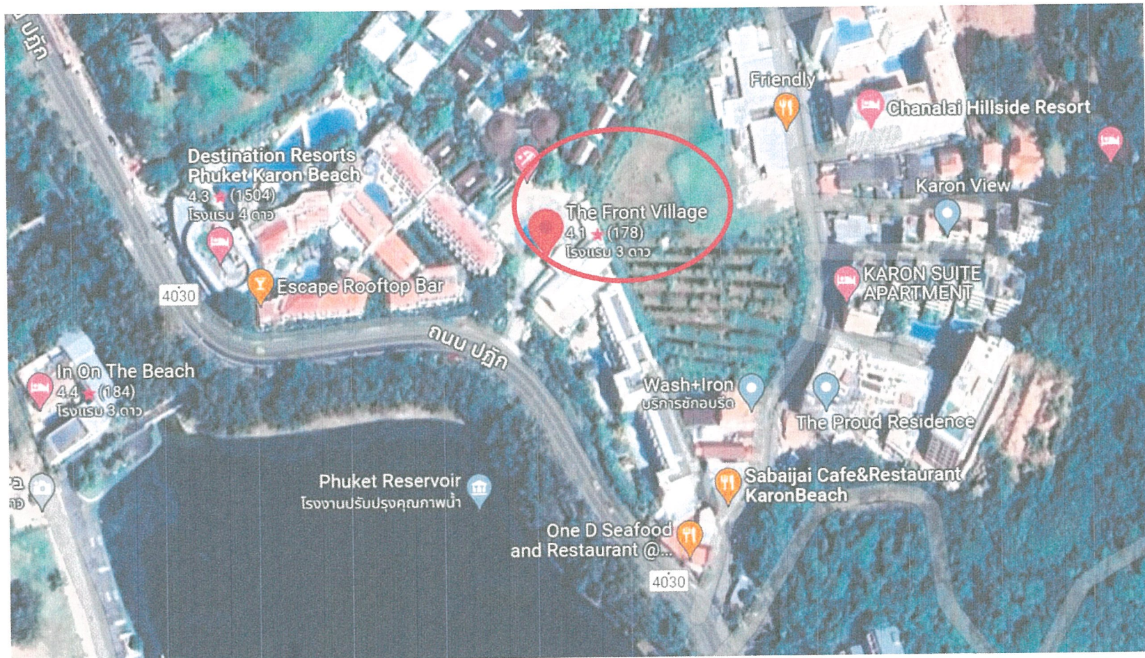
รูปภาพที่ 1.1 แผนที่ตั้งของโครงการ The Front Village (Top view)

รายงานผลการปฏิบัติตามมาตรการป้องกันและแก้ไขผลกระทบสิ่งแวดล้อมและมาตรการติดตามตรวจสอบคุณภาพสิ่งแวดล้อม โครงการ The Front Village ระยะดำเนินการ ระหว่างเดือน มกราคม – มิถุนายน 2566